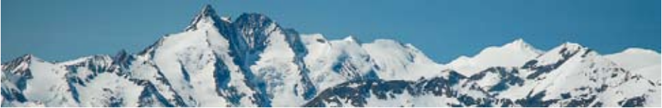
Großglockner, Glocknerwand, Schneewinkelscharte, Johannesberg, Hohe Riffel

1. Weniger, schwieriger: Die Gesamtzahl unserer Einsätze geht vorerst weiter zurück. Die Intensität der Einsätze verstärkt sich zum Teil in unerwarteten Ausmaßen. Viele sind auch länger.