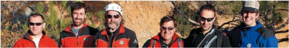
Internationale Kooperationen: Ausbildungsteam des ÖBRD für alpinistische Einsatzkräfte auf Zypern.