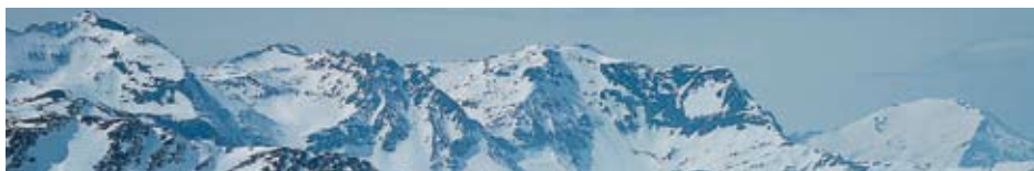
Schareck, Hocharn: Goldberggruppe bei Bad Gastein & Rauris

KONTAKTE: Wenden Sie sich bitte an eines der Büros unserer sieben Landesleitungen in dem Bundesland oder der Region Österreichs, wo Sie leben und/oder Urlaub machen. Hier finden Sie im Internet unsere Shortlist mit allen Kontakten: www.bergrettung.at