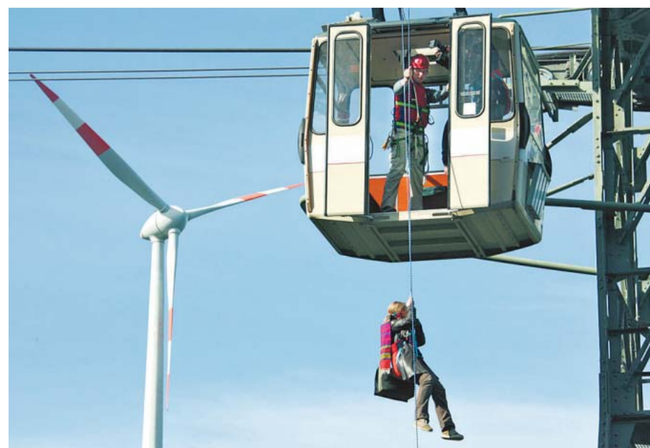
Die Übung macht's: Bergehelfer rettet Frau aus Seilbahnkabine.